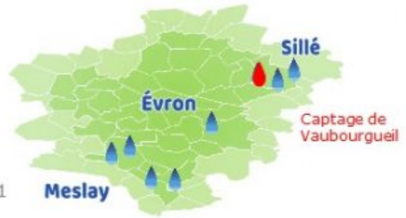
Illustration sur le territoire Du bassin de Vaubourgueil commune de Vimartin-sur-Orthe Octobre 2021